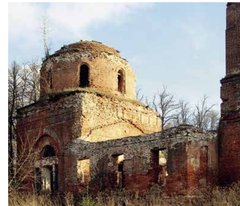
Воскресенский храм с. Купрово Можайского р-на