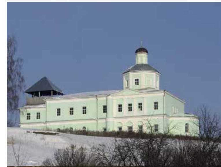
Сергиевский храм с. Горы

Каждый из них вносил свой вклад в формирование культурного наследия села. В селе были построены два храма: Введения во храм Пресвятой Богородицы и Сергиевский. Каждый из них имеет свою историю.