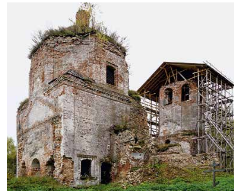
Христорождественский храм с. Ильинское Наро-Фоминского р-на