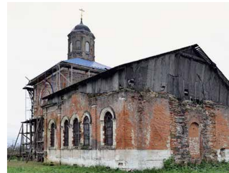
Покровский храм с. Нововасильевское Лотошинского р-на