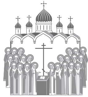
ПОЧИТАНИЕ НОВОМУЧЕНИКОВ И ИСПОВЕДНИКОВ