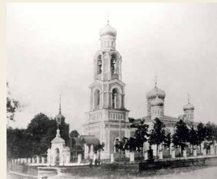
Храм Преображения в Бояркино

Постепенно деревянная церковь ветшала, кровля требовала обновления железного покрытия и покраски. Особые опасения вызывала деревянная колокольня, которая к н-