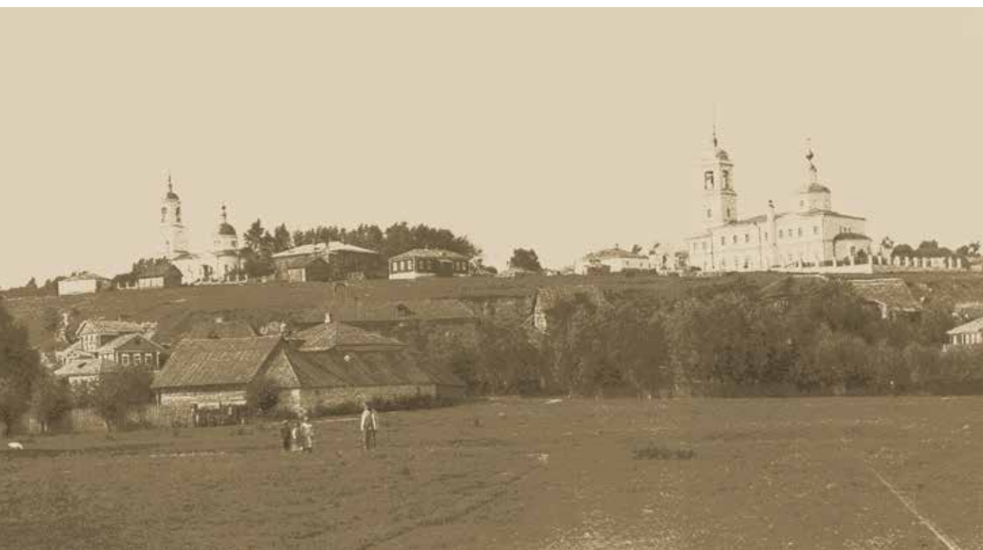
Село Горы, начало XX в.

Село Горы – большое село, расположенное в 160 км от Москвы. Оно расположено